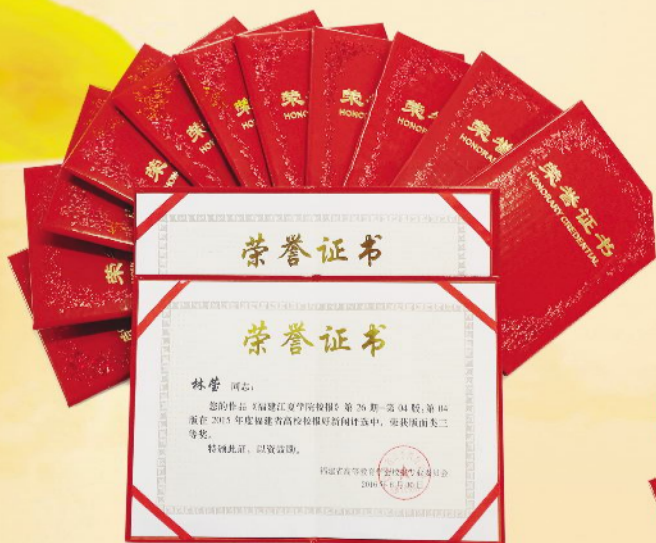
▲我校校报《福建江夏学院校报》26期4版获得2015年度福建省高校校报好新闻评选版面类三等奖。