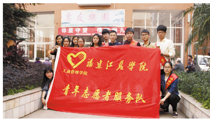
工商管理学院青年志愿者服务队