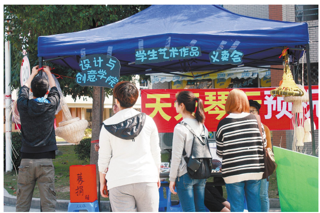
▲3月5日,设计与创意学院青年志愿者在生活区开展了以“传承艺术经典,弘扬雷锋精神”为主题的艺术作品义卖活动。