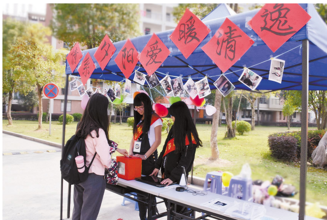
三月,我们在青年志愿者协会

早上8点,微风中略带寒意。生活区门口几位身穿志愿者绶带的同学在热情地分发活动宣传传单,人潮涌动中他们身上鲜红的绶带格外耀眼。 “同学你好,我们的活动是为了给清逸托老院的老人募捐……” “同学你好,有时间了解一下……”