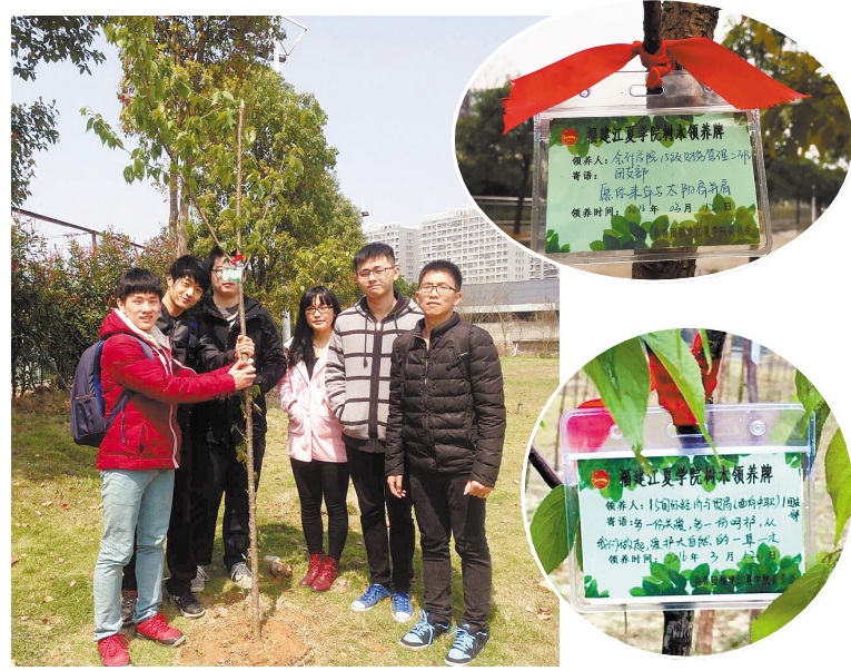
▲3月11日,我校师生在“师生情谊林”开展了以“青春雷锋——美丽校园”为主题的绿植领养活动。