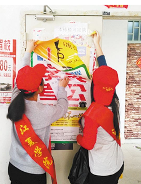
▲3月5日,经济与贸易学院青年志愿者开展宿舍楼道牛皮癣清理、整理过道的自行车等志愿服务活动。