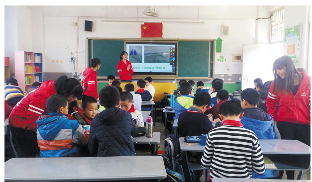
▲3月2日下午,金融学院青年志愿者开展了福州教育学院附属第三小学的支教活动。