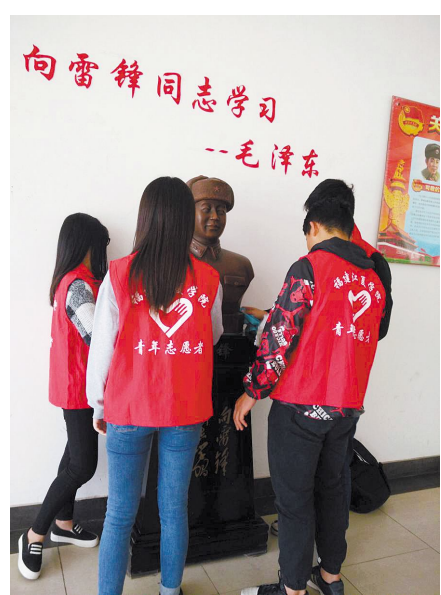
▲3月5日,法学院青年志愿者协会全体成员前往沙堤村隐惠福利院进行志愿服务活动。