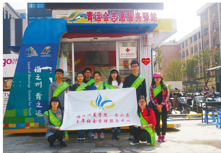
▲3月5日,公共事务学院青年志愿者到仓山区学生街青运会志愿服务驿站开展了主题为“同心协力,携手学雷锋”的交通引导活动。