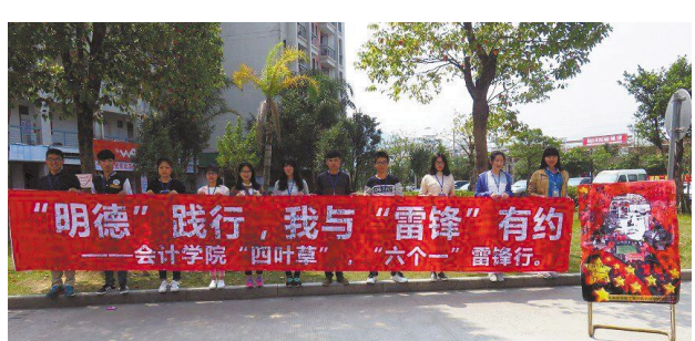
▲3月,会计学院青年志愿者开展了以“‘明德’践行,我与‘雷锋’有约”为主题的“四叶草”“六个一”行动系列活动。