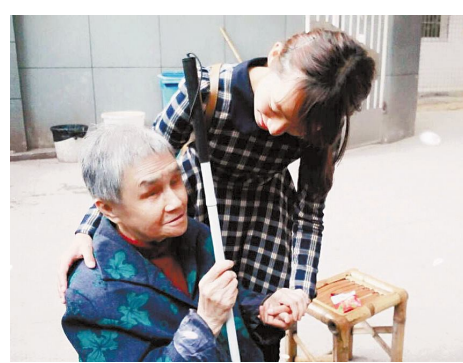
▲3月5日,校团委青年志愿者协会全体干事携手会在教学区五号楼开展了学雷锋义务活动。