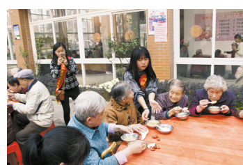
志愿者给孤寡老人送上爱心粥