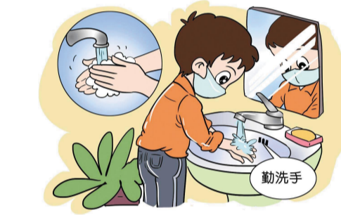
勤洗手 俞欣妍