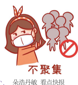
不聚集 荣浩丹敬 看点快报