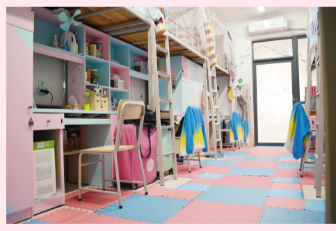
粉色古堡的装饰使得宿舍充满青春活力