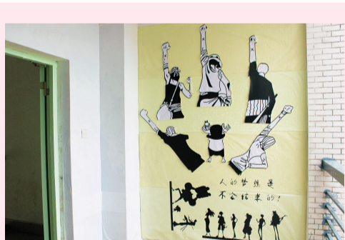
海贼王的典型手势展现了学子们力争上游的精神风貌