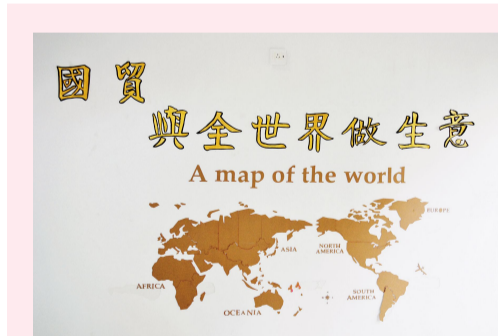
结合专业特色设计出独特的走廊文化

活动开始后，各宿舍成员全面响应，认真配合，着力做好宿舍卫生整理工作，在此基础上积极创新，对宿舍内部环境进行精