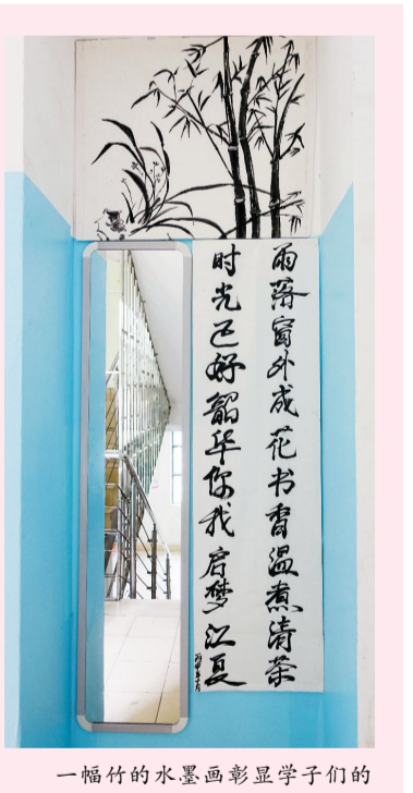
一幅竹的水墨画彰显学子们的君子风度，体现了浓浓的人文气息

心布置和创意装扮，创新设计舍标舍训，美化装扮自己的“温馨小窝”。各宿舍向广大师生展现出了不一样的想象力和创造力，有的宿舍用树叶做装饰，号召大家要提高环境保护意识；有的宿舍用彩色气球装饰白墙，寓意未来的大学生活缤纷多彩；有的宿舍在墙上贴上名人名言，营造浓厚的学习氛围；有的宿舍贴上他们自己喜欢的明星照片和海报，表达了大学生对美好生活的向往。他们用睿智的头脑和灵巧的双手，点缀了不同风格的生活空间与魅力。同时，专项工作小组还依托学院团委，以习近平总书记关于青年成长成才的重要讲话精神、学校校训精神、学院办学定位、专业特色、文明礼仪、创新创业等元素为主要内容，对宿舍楼的走廊、楼道和一楼大厅等公共区域进行精心布置，形成了特色走廊文化。走廊文化品牌得到了学校领导的赞扬，也得到了兄弟学院的广泛认可。值得一提的是，学院在12号宿舍楼活动室，初步建成了具有专业特色的“瀚海读书小屋”，为大学生搭建了生活园区自主学习专用平台。