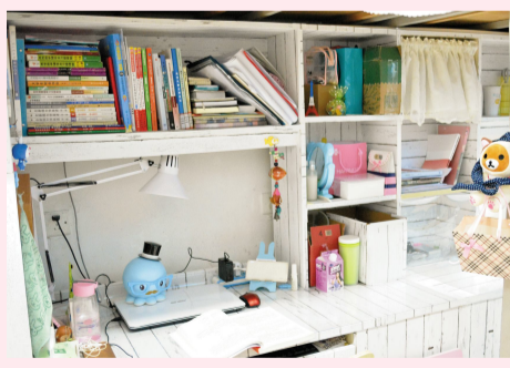
布局井然有序，摆放错落有致，体现学子们的认真严谨