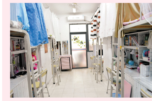
宿舍错落有致、窗明几净使得宿舍温馨舒适